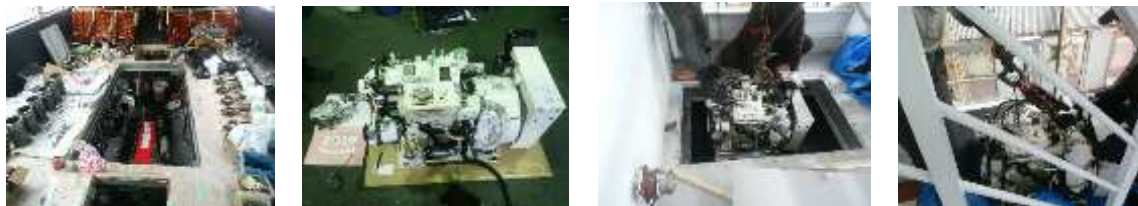
かもめ1号主機整備

各船を定期的に上架し、船体・船底等の点検・整備を計画に基づき実施しました。 また、施設・設備について、棧橋の安全対策を実施しました。