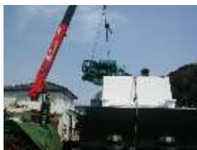
シーガルII主機整備