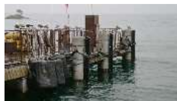
日出棧橋防眩取替工事