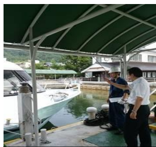
安全統括管理者職場巡視