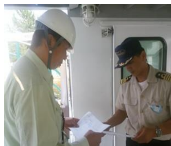
官公庁による監査・点検