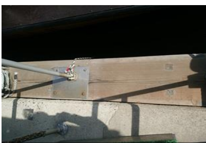
天橋立栈橋 木部分取替