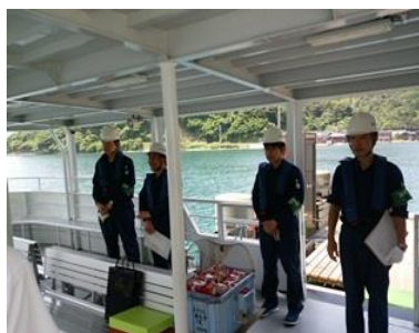
官公庁による監査・点検

安全管理体制や船舶運航上に不備等がないか、関係官公庁により定期的に監査・点検を行いました。