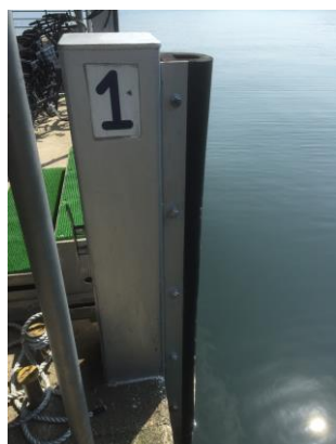
栈橋防舷ゴム取替