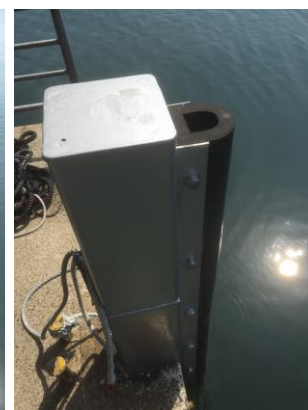
栈橋防舷ゴム取替