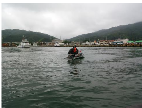
保安署、警察署等と合同水難訓練

各機関との連携、問題意識の共有を図るため、関係官庁(海上保安署、警察署)や地元関係事業者との緊急時対応訓練を実施しました。