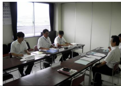
近畿運輸局による運輸安全マネジメント評価