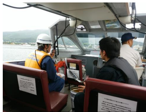
保安署、警察署等と合同水難訓練