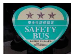
貸切バス事業者安全性評価認定制度三ツ星

日本バス協会が、貸切バス事業者の安全に対する取り組みを評価・認定する「貸切バス事業者安全性評価認定制度」において、2015年9月15日、三ツ星ランクの認定を受けております。