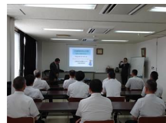
外部講師による事故防止研修会