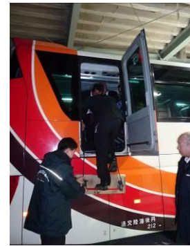
班会議中の非常口操作訓練

特に、新規採用運転手、事故惹起者に対しては添乗指導の強化を図りました。また、ドライブレコーダデータを活用した指導を行いました。