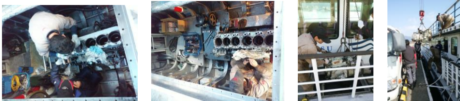
かもめ5号主機整備

各船を定期的に上架し船体・船底等の点検・整備を計画に基づき実施しました。また、施設・設備面では、桟橋の安全対策を実施しました。