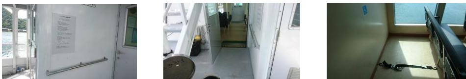
かもめ5号バリアフリー改修工事