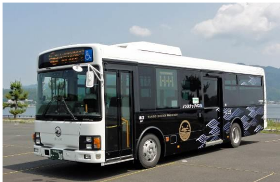
「ぐるっと丹後周遊バス（ぐるたんバス）」