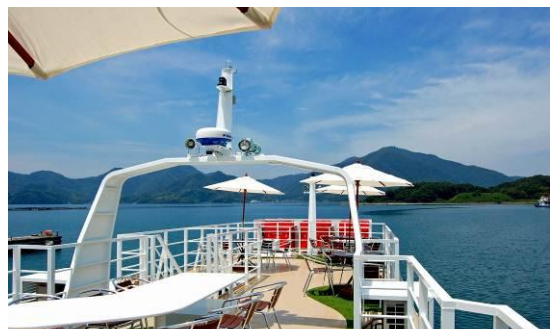
新造船「KAMOME6」2階デッキ（停泊時）

なお、KAMOME 6は伊根航路以外にも、伊根湾めぐり遊覧船として既存のかもめ5号とともに運航します。