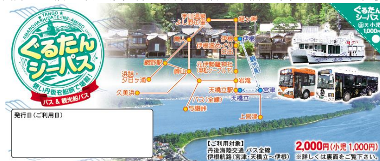
ぐるたんシーパス

販売期間：2014年8月2日～2014年10月26日 適用区間：〈航路〉天橋立・宮津～伊根（片道1回限り利用可能） 〈バス〉ぐるたんバス及び一般路線バス乗り放題 有効期間：当日のみ 料 金：大人2,000円 小児1,000円 販売場所：天橋立駅内観光案内所、天橋立棧橋他観光船のりば、伊根