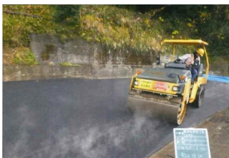
日出駅駐車場整備