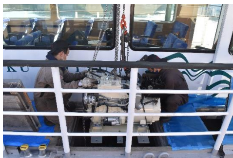
かもめ12号補機オーバーホール