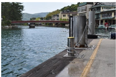
天橋立栈橋安全整備(係船柱・足場板)