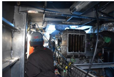
かもめ11号主機オーバーホール