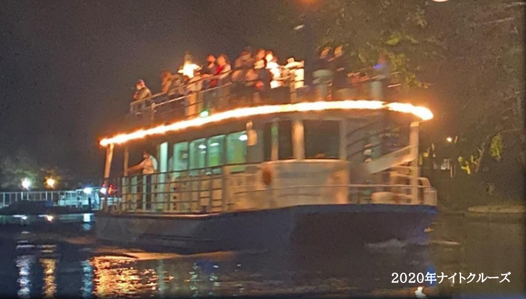
2020年ナイトクルーズ