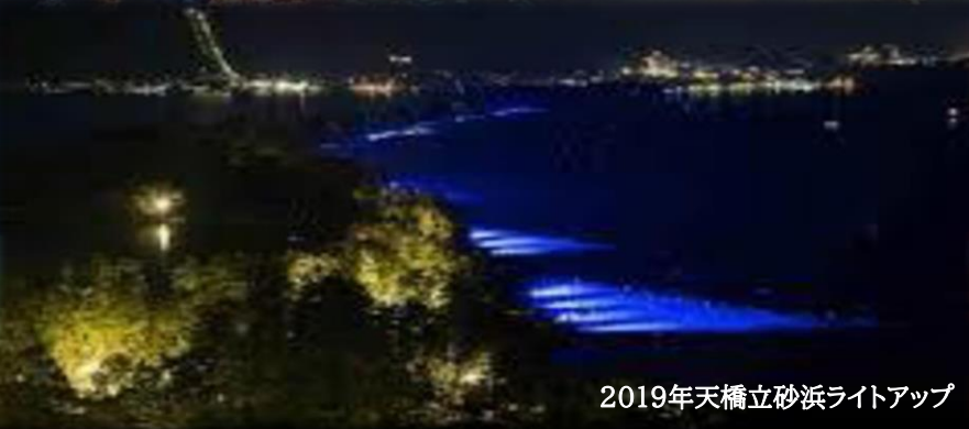
2019年天橋立砂浜ライトアップ