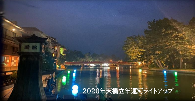
2020年天橋立年運河ライトアップ

天橋立砂浜ライトアップをバックにナイトクルーズを満喫！ さらに船上にて同日開催予定の宮津天橋立エール花火を鑑賞！